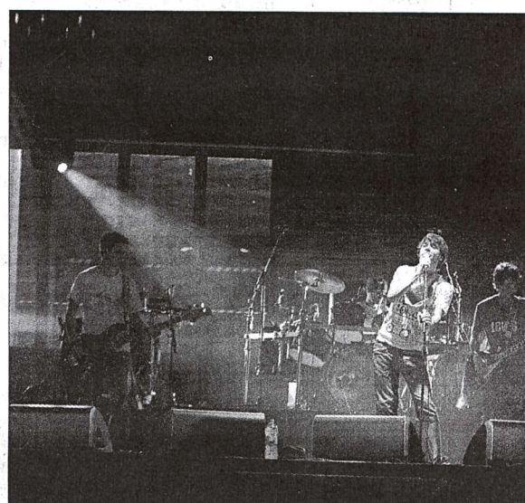
The Bärds subieron el telón del certamen oscense. M.G.