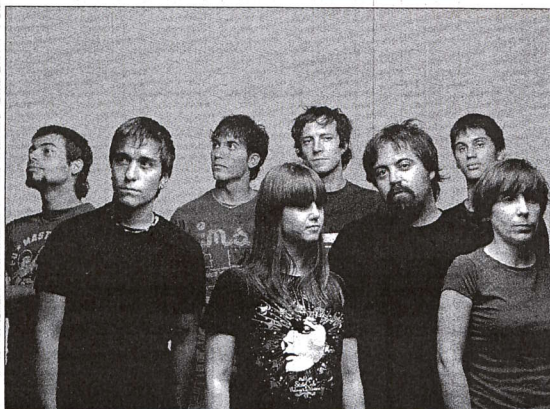
Imagen de los ocho miembros de Lucca.